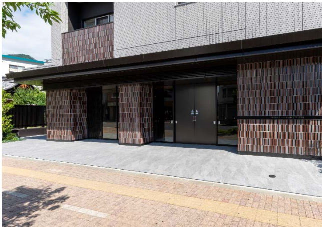
📷 「サーパス石堂ゲートマークス」 エントランス写真